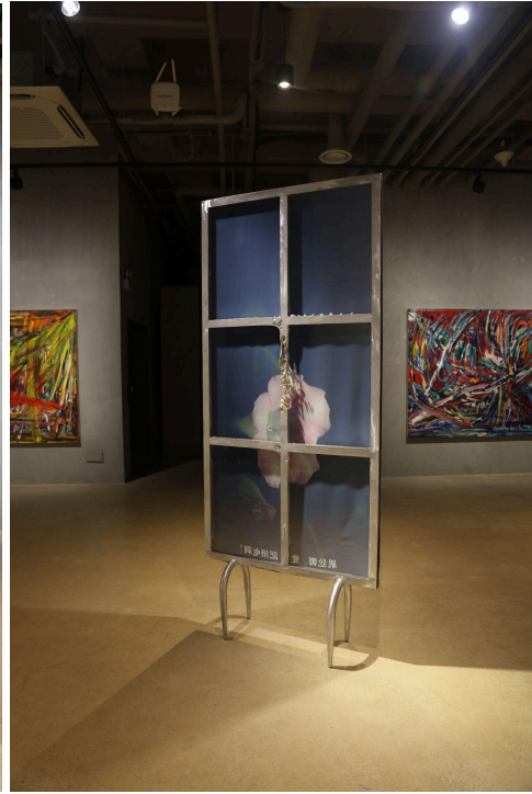
(좌) 2023년 5월 25일부터 6월 10일까지 아트스페이스3 《좋은 이웃》에 전시된 〈최재연〉 사진 파일, 2020.