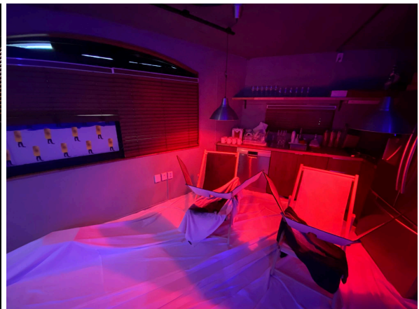
(좌) 2020년 8월 22일부터 9월 6일까지 라운지32 《모델하우스: 숲에서 생각한 것들.》 전경 사진 파일, 2020.