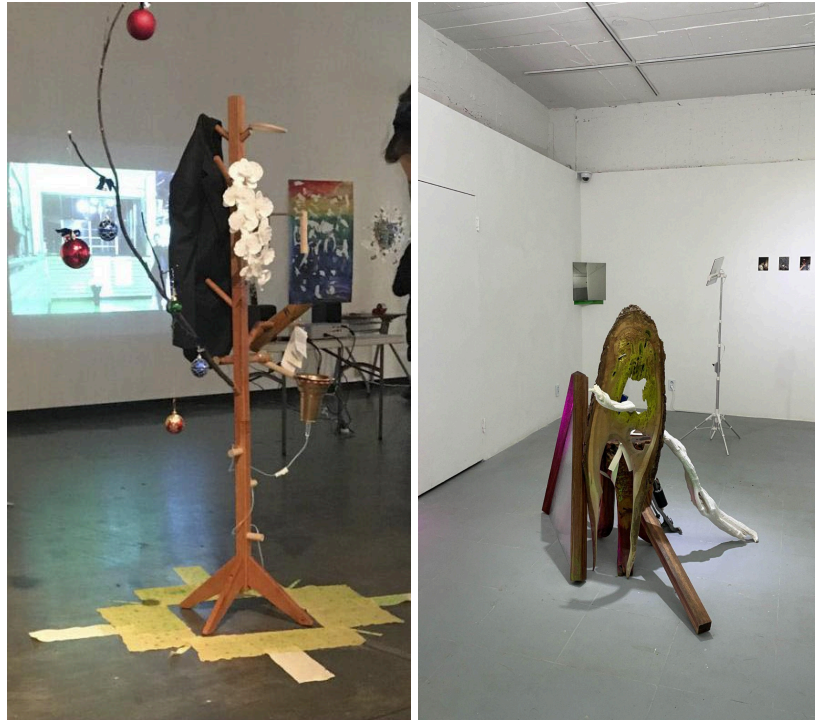
(좌) 2017년 학부 과제전 출품작 사진 파일, 2017.