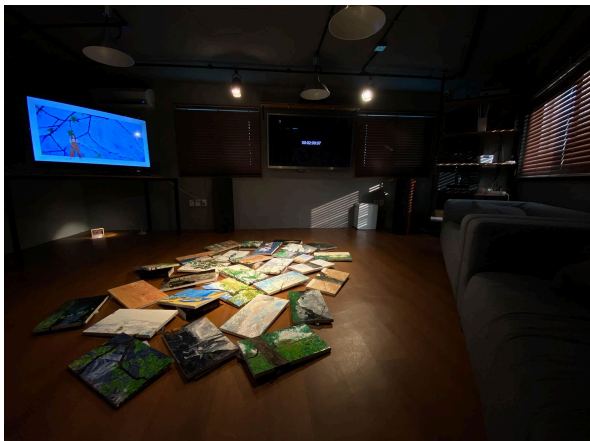
(우) 2020년 9월 25일부터 10월 10일까지 라운지32 《모델하우스: 33: 비바리움》 전경 사진 파일, 2020.