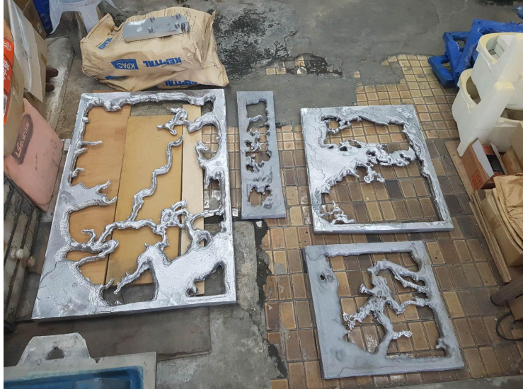
2024년 작품 제작 과정 기록 사진 파일, 2024. 촬영: 임다을.