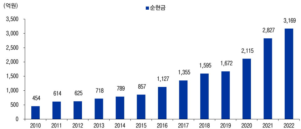
그림3 리노공업 순현금 추이