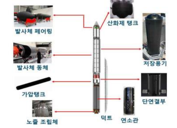
그림 4. 우주/항공 탄소복합재 적용 분야(소형발사체)