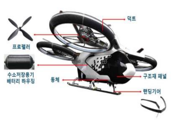
그림 3. 우주/항공 탄소복합재 적용 분야(4인승급 UAM)