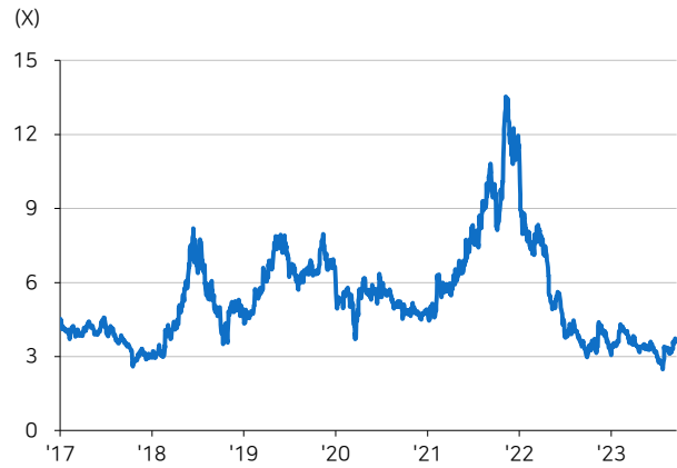
그림3 아프리카TV Trailing PBR