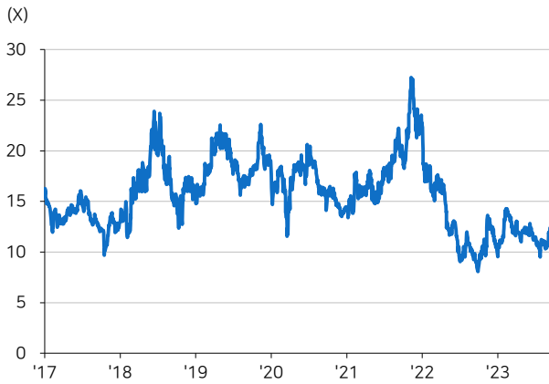
그림2 아프리카TV 12M Fwd PER

주: 한국인 안드로이드+iOS 앱 사용자 추정 자료: 와이즈앱, 메리츠증권 리서치센터